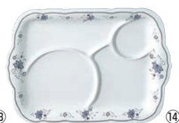
⑭角皿B 仕切付 15.2インチ BF-25